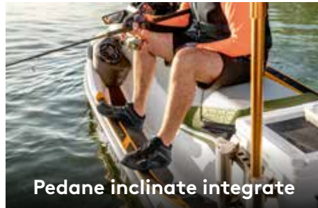
Pedane inclinate integrate

Aggiunge 28,3 cm sul retro della moto d'acqua per aumentare la stabilità, lo spazio e la capacità di carico.