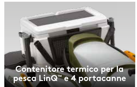
Contenitore termico per la pesca LinQ™ e 4 portacanne

Ottimizzato per garantire spostamenti facili intorno alla moto d'acqua e offrire maggior comfort e stabilità quando si è posizionati lateralmente.