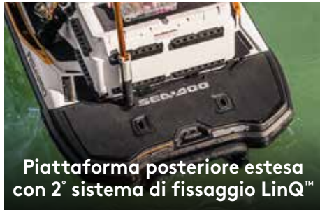
Piattaforma posteriore estesa con 2° sistema di fissaggio LinQ™

Capiente contenitore termico con sistema di fissaggio rapido progettato per offrire un facile accesso e numerose funzioni pratiche.