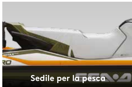
Sedile per la pesca

Sistema di navigazione, visualizzazione dei dati cartografici e individuazione dei pesci al top di gamma che utilizza la tecnologia CHIRP per fornire immagini ad alta definizione.