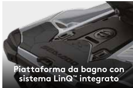
Piattaforma da bagno con sistema LinQ™ integrato

Ampio vano di carico anteriore facilmente accessibile dalla posizione seduta. 1