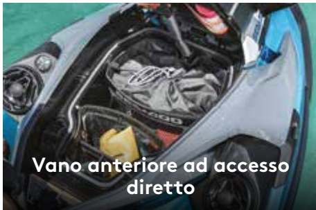
Vano anteriore ad accesso diretto

Ampio vano di carico anteriore facilmente accessibile dalla posizione seduta. 1