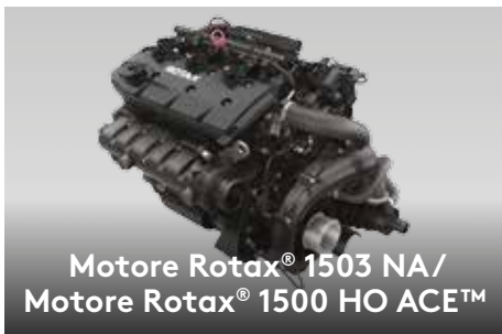
Motore Rotax® 1503 NA/ Motore Rotax® 1500 HO ACE™

Il primo sistema audio Bluetooth ‡ del settore montato dal costruttore e completamente impermeabile. 2 Di serie su GTX 230. (Accessorio per GTX 155)