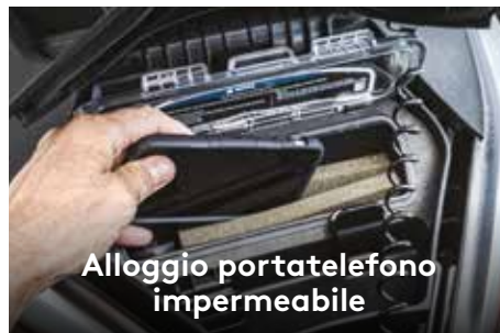
Alloggio portatelefono impermeabile

Il motore Rotax® 1503 NA offre accelerazione istantanea per un divertimento istantaneo, mentre il motore 1500 HO ACE™ è dotato di un potente sovralimentatore e della tecnologia a combustione efficiente avanzata (ACE).