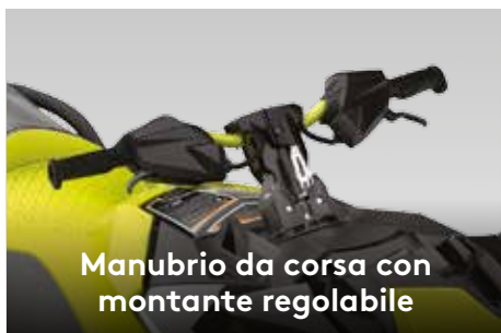
Manubrio da corsa con montante regolabile

Il sedile stretto con recessi per le ginocchia consente di sedersi in maniera naturale e di utilizzare le gambe per aderire alla moto d'acqua e ottenere un maggiore controllo.