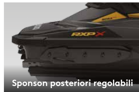
Sponson posteriori regolabili

Limita il brusco sollevamento della prua e migliora le prestazioni in tutte le condizioni dell'acqua.