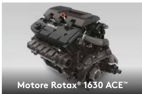
Motore Rotax® 1630 ACE™

Il Rotax® 1630 ACE è il più potente motore Rotax® in assoluto e garantisce massima efficienza e straordinaria accelerazione.