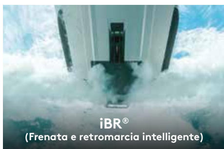
iBR® (Frenata e retromarcia intelligente)

Esclusivo sistema di attacco rapido sulla piattaforma da bagno più ampia del settore per una facile installazione degli accessori di carico.