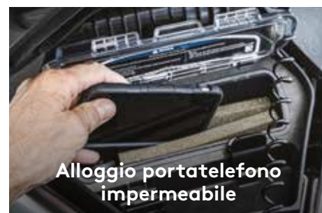
Alloggio portatelefono impermeabile

Uno scafo innovativo che rappresenta il nuovo riferimento del settore in termini di manovrabilità nelle acque mosse, stabilità e prestazioni offshore.