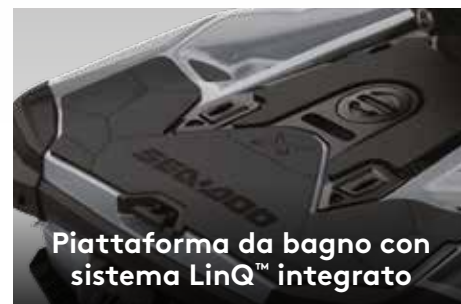
Piattaforma da bagno con sistema LinQ™ integrato

Il primo sistema audio Bluetooth 3 del settore montato dal costruttore e completamente impermeabile.