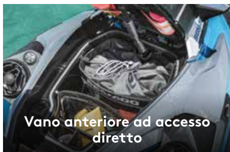
Vano anteriore ad accesso diretto

Ampio vano di carico anteriore facilmente accessibile dalla posizione seduta. 1