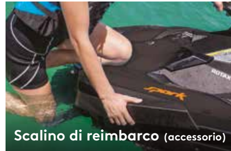
Scalino di reimbarco (accessorio)

Progettato per migliorare la libertà di movimento durante la guida.