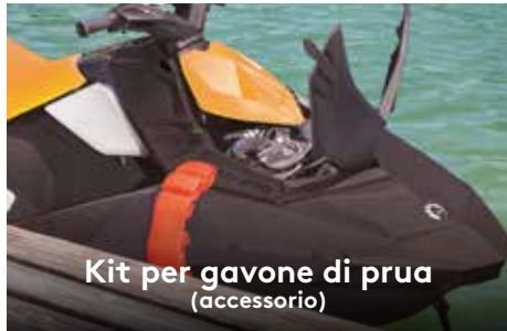
Kit per gavone di prua (accessorio)

Due opzioni di motore Rotax® efficienti, compatti e leggeri.